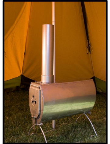
STÄLL KAMINEN PÅ PLATS. SÄTT PÅ DEN FÖRSTA SEKTIONEN AV RÖKRÖRET. KAMINEN STÅR STADIGARE OM DEN PLACERAS PÅ ETT PAR SLANOR.