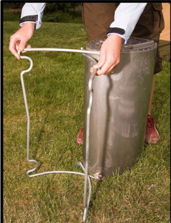
FÅLL UT BENEN.

LÄS OCKSÅ "VIKTIGT VID ELDNING" INNAN DU BÖRJAR.