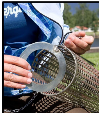
PLACERA BRICKAN INUTI ISOLERINGSRÖRET, SÅ ATT KEDJAN STICKER UT GENOM ÖVERSTA RADEN AV HÅL.