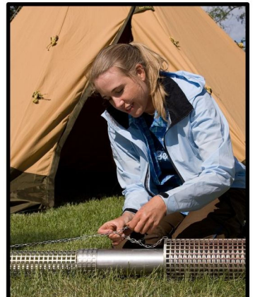
FÄST KEDJANS ÖVRE ÄNDE NEDERST PÅ GNIKSTLÄCKAREN.