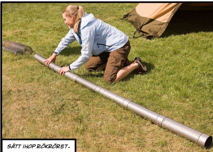
SÄTT IHOP RÖKRÖRET.