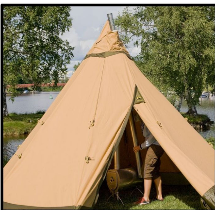
FÖR UPP RÖRET GENOM ÖPPNINGEN I VENTILMÖSSAN.