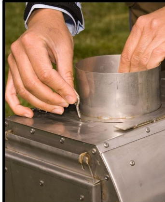
ANVÄND LÅSPINNEN FÖR ATT SÄKRA BAJONETTRÖRET.