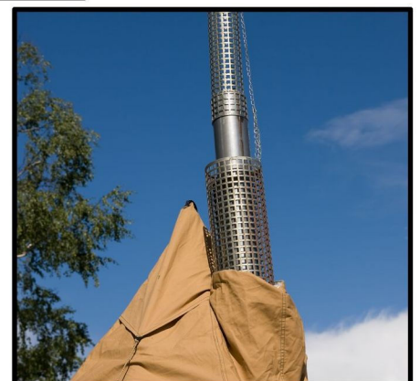
JUSTERA HÖJDEN PÅ ISOLERINGSRÖRET, SÅ ATT TÄLTDUKEN INTE KAN KOMMA I KONTAKT MED RÖKRÖRET.