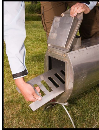
SÄTT IN RÖSTRET.